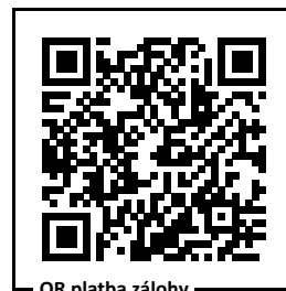
QR platba zálohy

Nejedná se o daňový doklad pro uplatnění DPH.